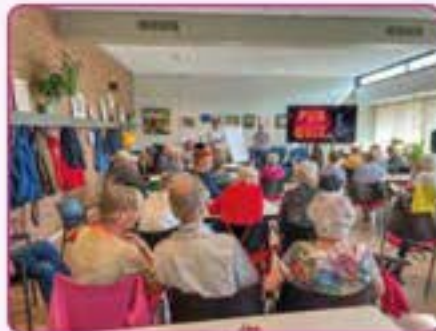
Pub quiz op de startzondag

Het komende jaar willen we het liturgisch centrum vernieuwen en de opbrengsten van Kerkbalans gebruiken voor jeugdwerk, pastoraat, onze kerkapp en voor verduurzaming van het kerkgebouw. Alleen samen kunnen we dit waarmaken! Ook in de toekomst kunnen we dan een gastvrije plek blijven waar mensen zich veilig en door God geliefd weten.