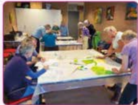
Schilderen voor advent en kerst 2023

Om ons heen zien we een samenleving waar de tegenstellingen tussen mensen soms hoog oplopen. Fijn dat de kerk in Zeist-West dan een gastvrije ruimte mag zijn, waar we op adem komen en met elkaar in gesprek gaan over de kern van ons leven. Waar we samen zoeken naar bezieling en inspiratie vinden.