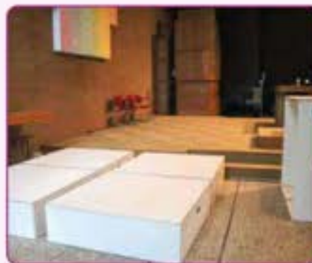
Onderdelen voor nieuw podium

Geef vandaag voor de kerk van morgen: een kerk die inspirerend, gastvrij en verbindend is. Jouw steun is daarbij van onschatbare waarde.